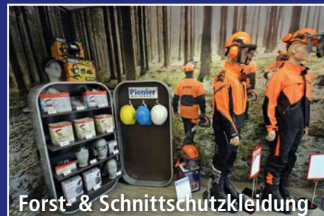
Forst- & Schnitenschutzkleidung