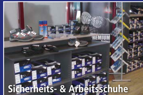
Sicherheits- & Arbeitsschuhe