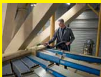
Silo-Sauger IVM 40/24-2 H ACD Adv Farmer