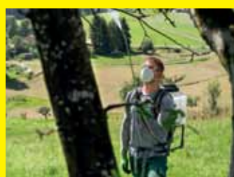
Akkubetriebener Drucksprüher SPB 15/36 Bp