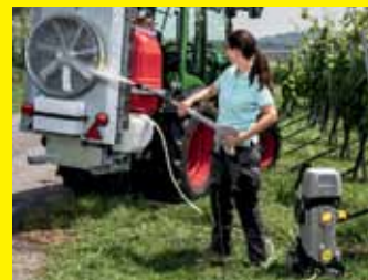
Akku-Feldspritzenreiniger HD 4/11 C Bp Pack Plus Farmer

** Bei Online-Registrierung unter www.kaercher.de/garantie24 innerhalb von 6 Wochen nach Kauf, spätestens bis 12.02.25, wird die Hersteller-Garantie von 12 auf 24 Monate verlängert. Nur gültig für die hier aufgeführten Aktionsprodukte.