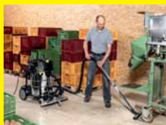
Multifunktions-Flächensauger NT 75/2 Tact 2 Adv Farmer