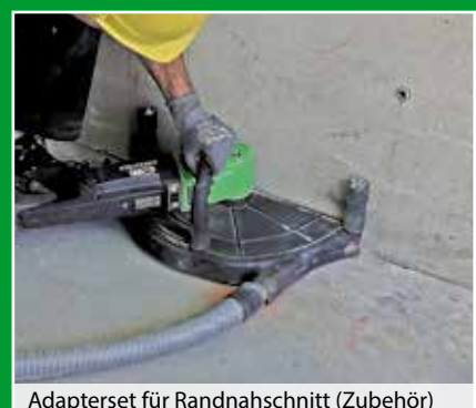
Adapterset für Randnahschnitt (Zubehör)