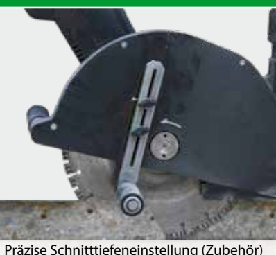
Präzise Schnitttiefeneinstellung (Zubehör)