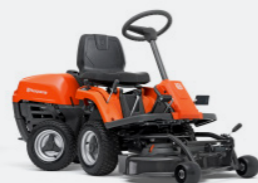
HUSQVARNA R 112C Husqvarna Motor, Hydrostatikgetriebe. Inkl. Mähdeck Combi 85.