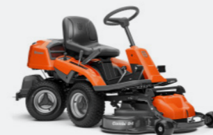
HUSQVARNA R 213C Briggs & Stratton Motor, Hydrostatikgetriebe. Inkl. Mähdeck Combi 94.