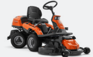
HUSQVARNA R 216T AWD Briggs & Stratton Motor, Zweizylinder, Hydrostatikgetriebe, Allradantrieb. Optionale Mähdecks: Combi 94, Combi 103.

€ 5.328,97 exkl. Mähdeck Mähdecks ab € 1.126,48