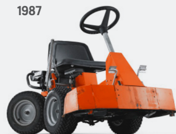
Ein früher Prototyp