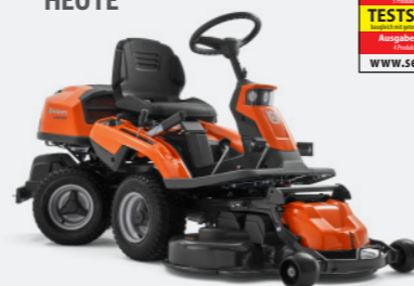
Husqvarna R216T AWD