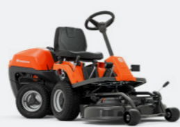
HUSQVARNA R 115C Briggs & Stratton Motor, Hydrostatikgetriebe. Inkl. Mähdeck Combi 95.