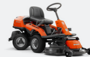
HUSQVARNA R 214TC Briggs & Stratton Motor, Zweizylinder, Hydrostatikgetriebe. Inkl. Mähdeck Combi 94.