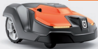
Automower® 550 EPOS