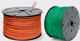
Extra starkes Begrenzungskabel