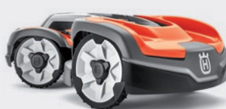
Automower® 535 AWD