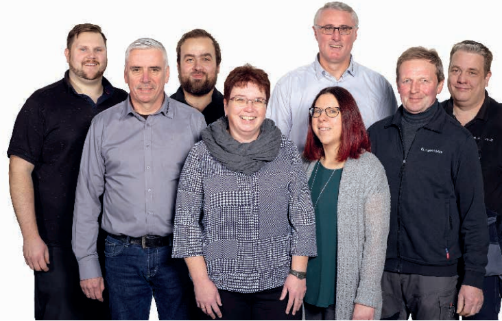
Das Team deterding + gräpel